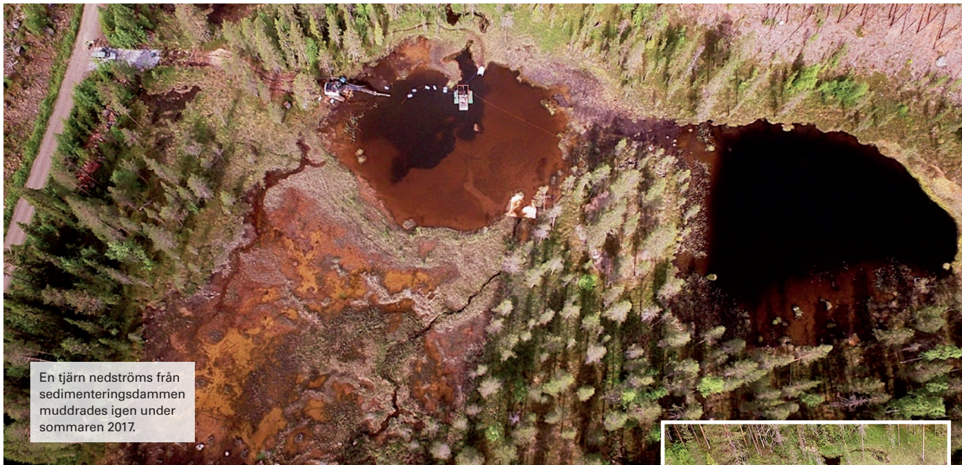
En tjärn nedströms från sedimenteringsdammen muddrades igen under sommaren 2017.